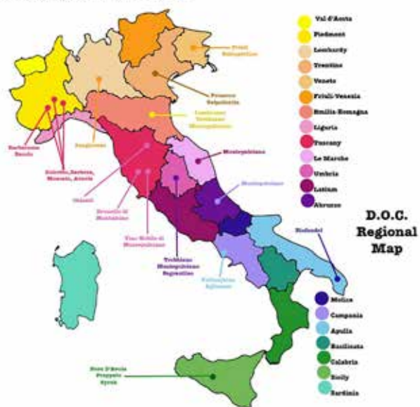
Mapa de las Regiones de Denominazione di Origine Controllata.