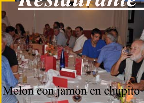
Melón con jamon en chupito