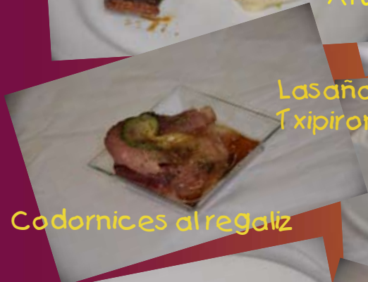
Codornices al regaliz