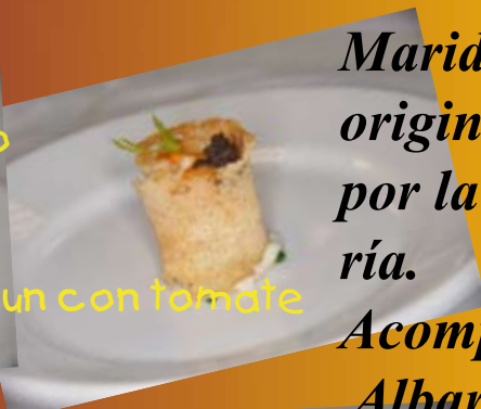
Lasaña de Txangurro Txipiron relleno