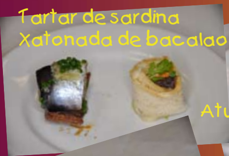
Tartar de sardina Xatónada de bacalao