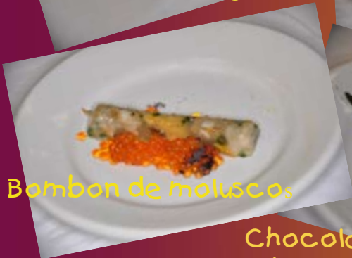
Bombon de moluscos