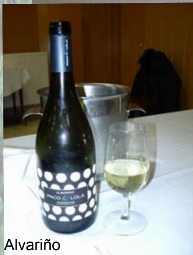
Alvarinho Paco y Lola

Es una empresa que une a un grupo de bodegas españolas de diferentes denominaciones de origen, dedicada a la creación y gestión de marcas, así como de la comercialización y distribución de las mismas.