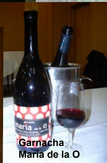
Garnacha Maria de la O